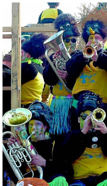
«Affe mit Speuz»: Die Speuzer Schränzer im Affenkäfig.