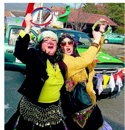
In Festlaune: Fasnacht pur bei strahlendem Sonnenschein.