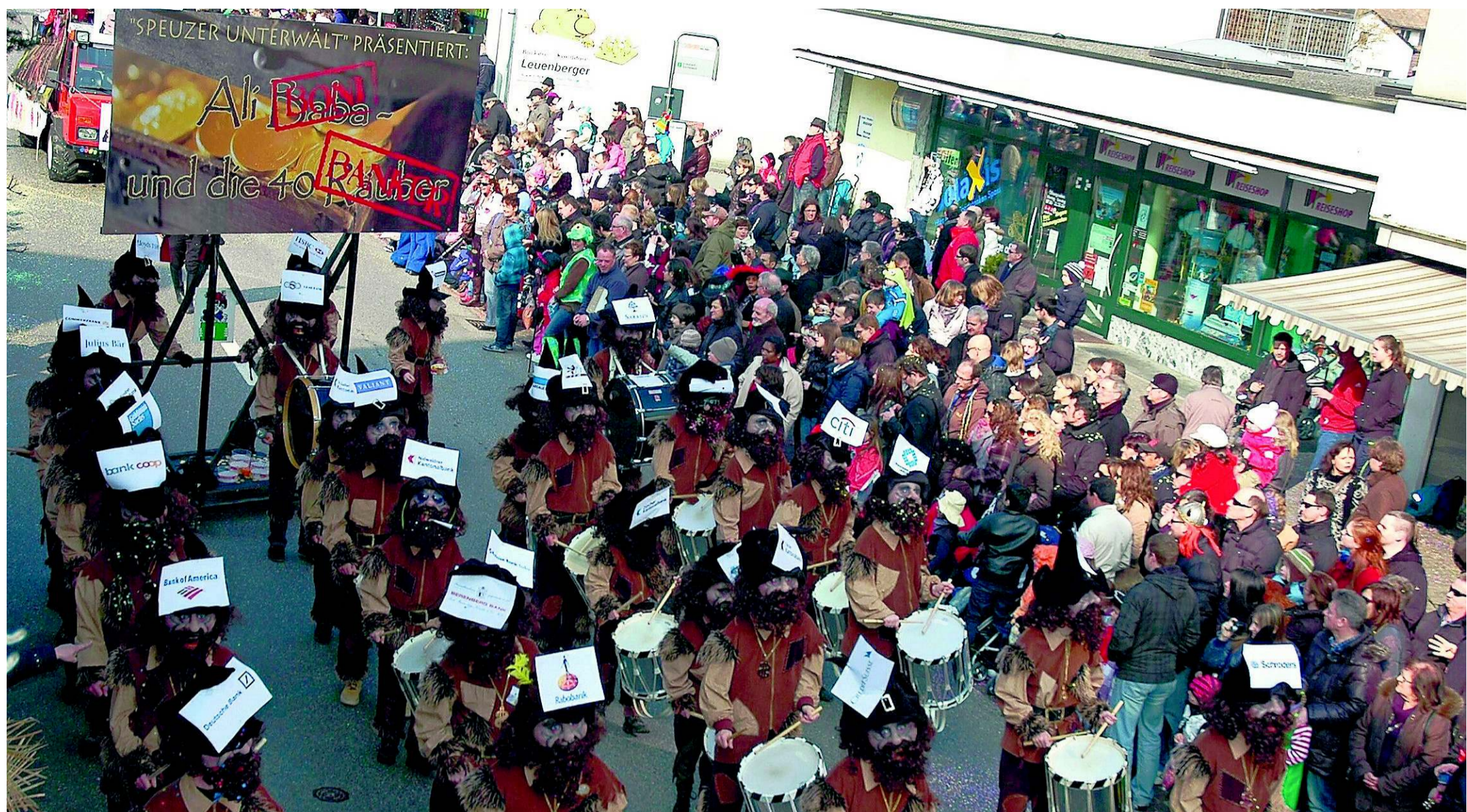
Der Tambourenverein Erlinsbach eröffnete traditionsgemäss den Fasnachtsumzug – und verteilte vor über 10 000 Zuschauern fleissig Boni.