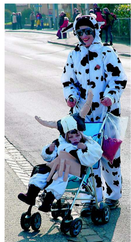
Die Fasnacht ist auch ein Fest für die Kleinen.