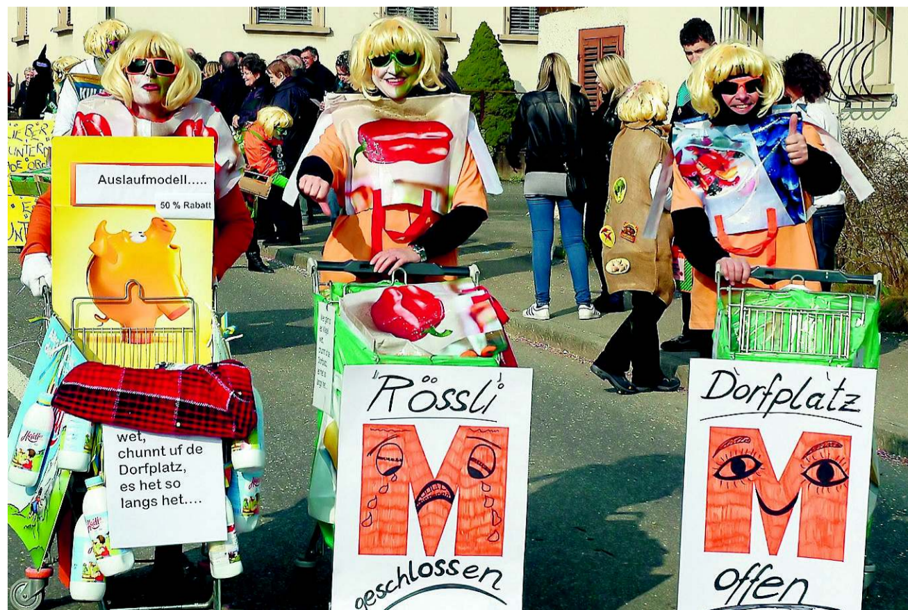
Die Oberreder-Fasnächtler nahmen das Dorfthema Nummer eins auf: Die neue Migros im Speuzer Oberdorf.