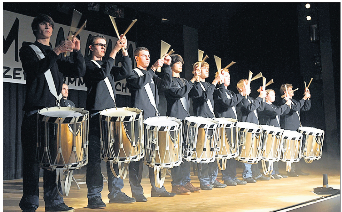
ERSTKLASSIG Die Erlinsbacher Jungtambouren begeisterten auch bei Showelementen. E. FREUDIGER

Zu Beginn zeigten die 27 Jungtambouren des Vereins ihre Klasse. Sie stimmten bei klassischen Trommel- sowie rhythmischen Unterhaltungsstücken mit Bongo und Rasseln die Zuschauer auf einen unterhaltsamen Samba-Abend ein. Bereits von den jüngsten Trommlern wurde bald eine Zugabe verlangt. Nachdem sie diese bei einem temporeichen Stück mit