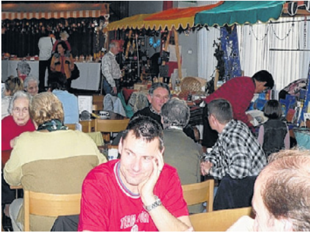
Die Besucher wurden am Basar auch kulinarisch verwöhnt.