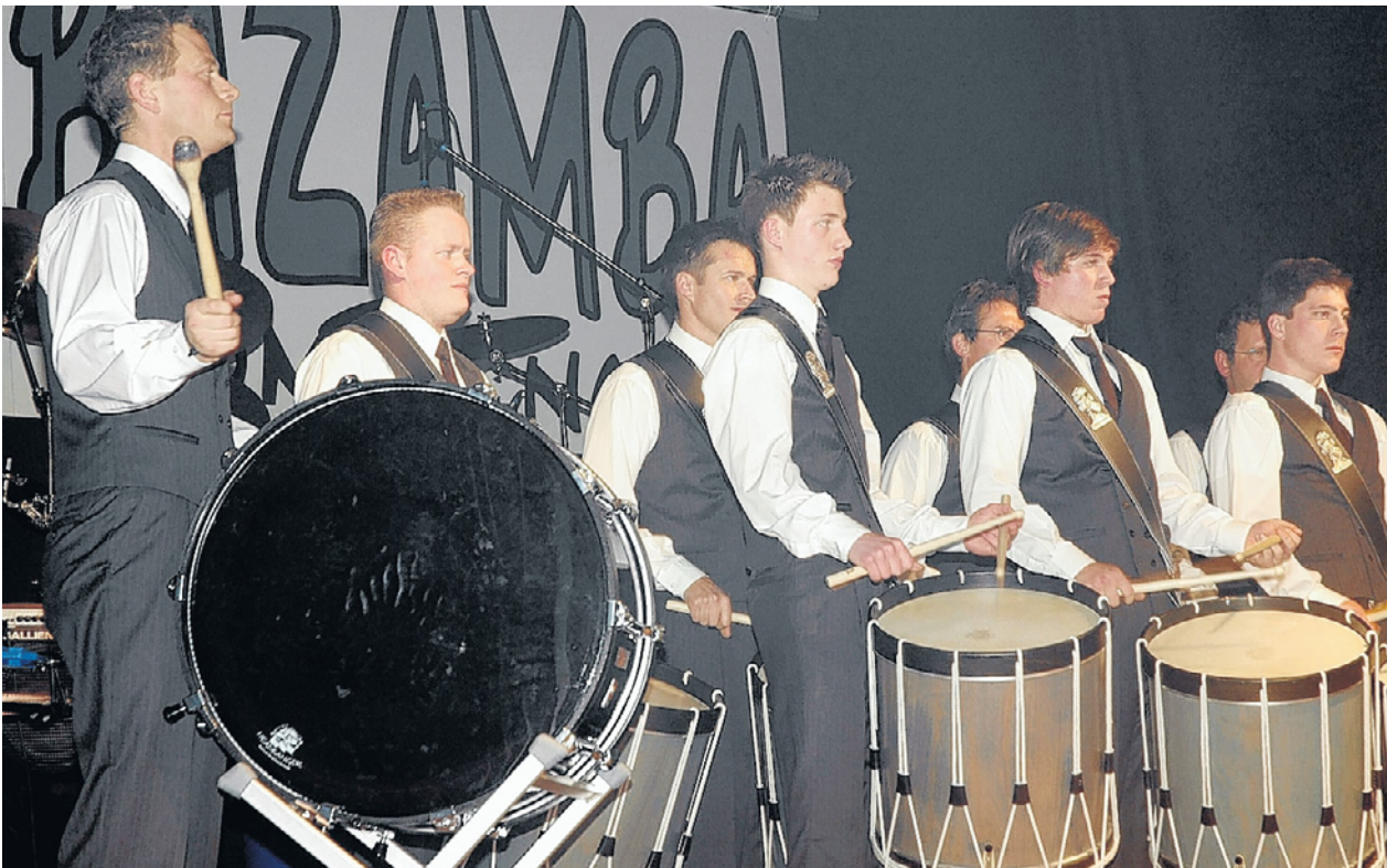
Kraftvoll, kreativ und professionell präsentierte sich die Drum-Bazamba mit dem Tambourenverein Erlinsbach in herkömmlicher Aufmachung und im Star-Wars-Kostüm (Bild links und oben). Die Jungtambouren traten ebenfalls auf – und erteten viel Applaus (kleines Bild rechts).